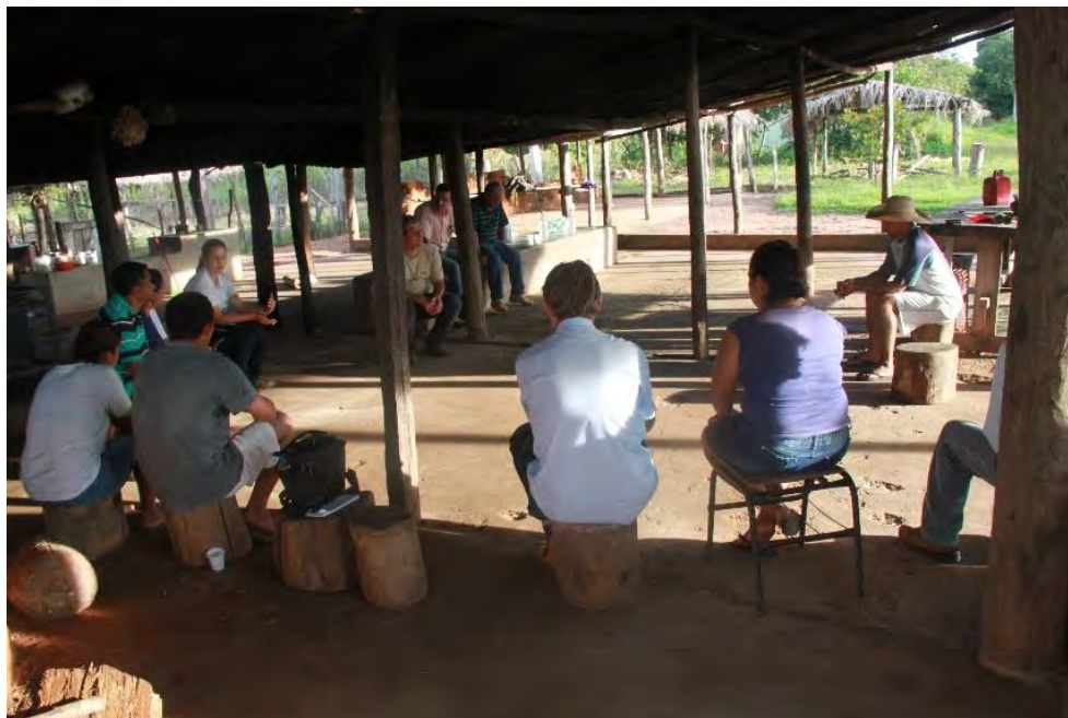
Figura 1. Comunidade São Benedito, Poconé, Mato Grosso.

Quanto ao aspecto social, as comunidades foram estudadas no ano de 2014, e em linhas gerais a tendência é a que marca diferentes áreas agrícolas de todo país, demonstra um processo de masculinização e envelhecimento. Apesar de não apresentarem características de isolamento e possuírem relativa infraestrutura, a saída do jovem da zona rural é marcante, principalmente em busca de melhores empregos e educação. Fica evidente a necessidade de políticas públicas voltadas para novas estratégias de educação que visem à valorização do conhecimento e trabalho agrícola, buscando a permanência do jovem no campo com qualidade de vida (Oler, 2017).