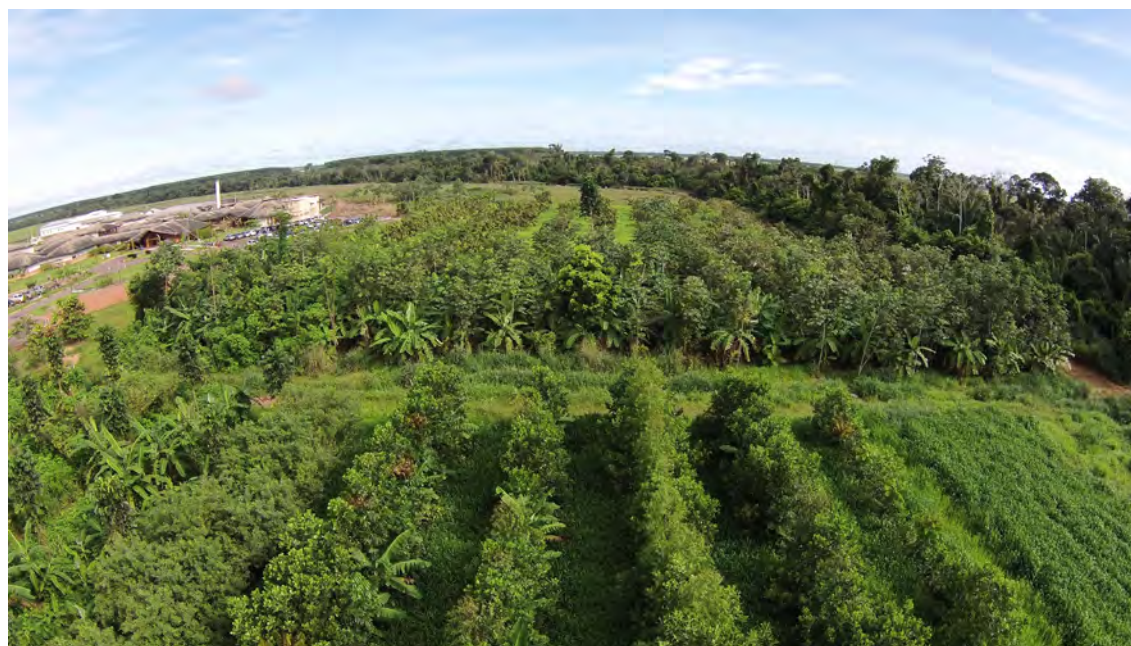
Figura 4. Vista aérea das áreas demonstrativas de SAFs instalados na Vitrine Tecnológica da Embrapa Agrossilvipastoril.