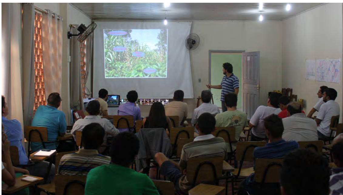
Figura 3. Troca de experiências durante o Módulo 6 – Sistemas Silvopastoris, Alta Floresta, MT.