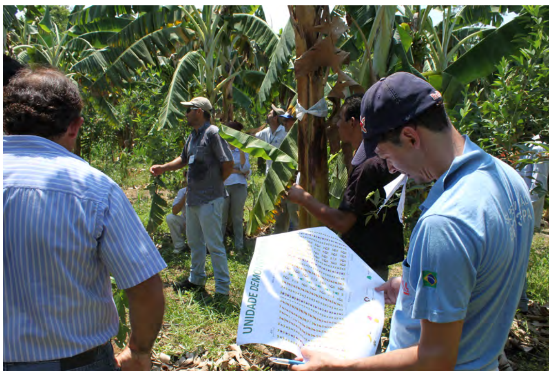
Figura 2. Atividade prática sobre planejamento de SAFs – Módulo 3, Embrapa Agrossilvipastoril, Sinop, MT.