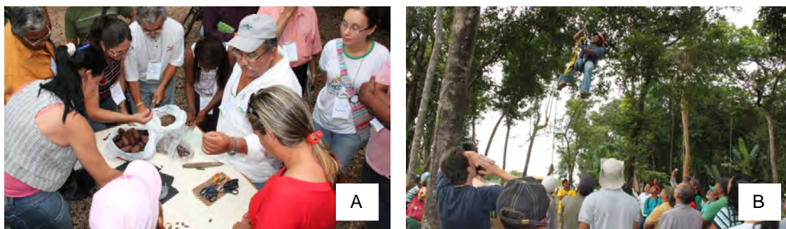
Figura 1. A: prática de beneficiamento de sementes nativas durante curso realizado em Confresa (MT), no projeto Amazônia Nativa (dezembro/2011). B: treinamento de escalada vertical – arborismo realizada durante mesmo curso (dezembro/2011).