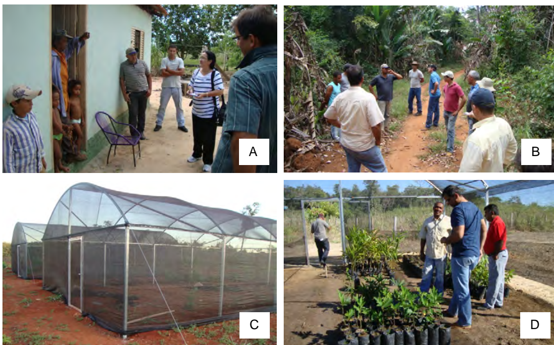
Figura 2. A e B: entrevistas com assentados para definição das Áreas de Coleta de Sementes em Confresa, para o projeto Amazônia Nativa (maio/211). C e D: instalação de estruturas de viveiros para produção de mudas em assentamentos de Confresa, MT, para o projeto Amazônia Nativa (dezembro/2011).

Paralelamente à definição e marcação das ACS foram montados 12 viveiros de apoio em assentamentos previamente selecionados junto a um comitê municipal, preferencialmente em locais próximos de escolas rurais, o que possibilitaria seu uso para fins didáticos e também auxiliaria no fornecimento de água, um grande limitante na região (Figuras 2B). Em uma fase final do projeto, em 2013, a equipe da Embrapa Agrossilvipastoril prestou apoio na regularização das ações junto ao MAPA, com cadastramento das ACS, dos viveiros e dos assentados que lidariam com a coleta de sementes e produção de mudas no município.