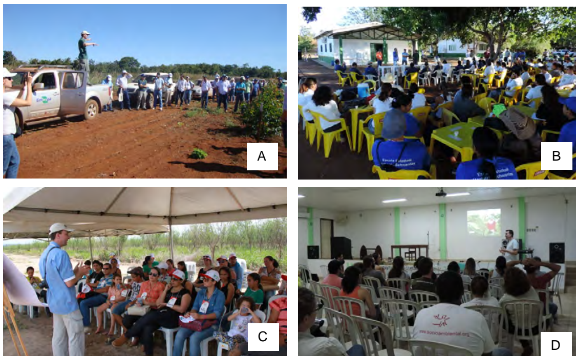
Figura 4. A: Primeiro dia de campo do projeto de recomposição de Reserva Legal em Canarana, MT (junho/2012). B: Terceiro dia de campo em Canarana, MT (maio/2014). C: Terceiro dia de campo em Guarantã do Norte, MT (novembro/2014); D: palestra durante intercâmbio técnico-científico da Unemat Nova Xavantina e Rede de Sementes do Xingu, em Nova Xavantina, MT (maio/2015).

Palestras e cursos foram também conduzidos a partir de convites de parceiros, como da Secretaria de Estado de Meio Ambiente do Mato Grosso (SEMA/MT), do Projeto Rural Sustentável, do SENAR, da organização não-governamental The Nature Conservancy (TNC), da Associação Rede de Sementes do Xingu (Figura 4D), entre outros.