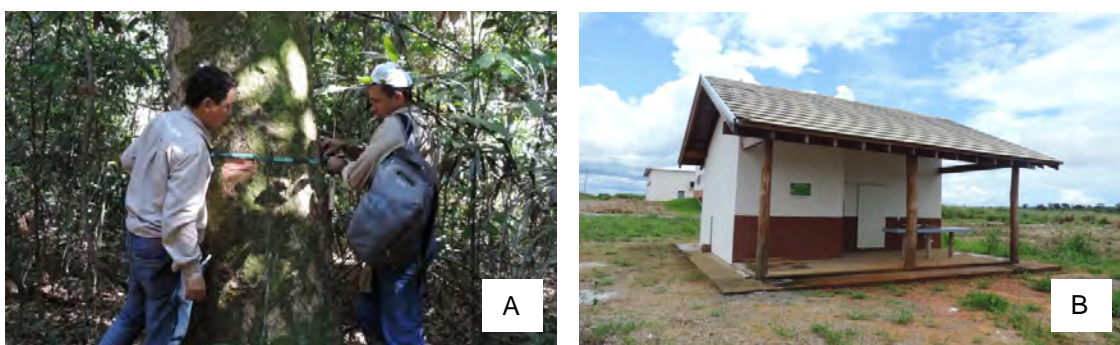
Figura 3. A: Marcação de matriz em Área de Coleta de Sementes dentro da Embrapa Agrossilvipastoril, como parte das ações do Projeto Semeando o Bioma Cerrado – Fase 2 (julho/2014). B: Casa de Sementes construída a partir do projeto na Embrapa Agrossilvipastoril, base para futuras ações de pesquisa e transferência de tecnologia em sementes nativas e regularização ambiental (fevereiro/2017).

Além disso, foram realizados cursos e dias de campo onde foram abordados temas como identificação botânica, produção de mudas nativas e recuperação de áreas degradadas, com envolvimento de aproximadamente 60 pessoas. Como suporte à pesquisa e também às futuras capacitações, o projeto viabilizou a construção de uma Casa de Sementes na Embrapa (Figura 3B), que será ainda incrementada com sistemas de refrigeração e mobiliário através de futuras parcerias. Embora prematuramente interrompido devido a restrições orçamentárias do patrocinador, o projeto serviu como base para o início de atividades ligadas ao manejo de sementes e mudas nativas na região, contribuindo para a busca por regularização ambiental de propriedades rurais e para a promoção de fontes de renda alternativas aos agricultores.