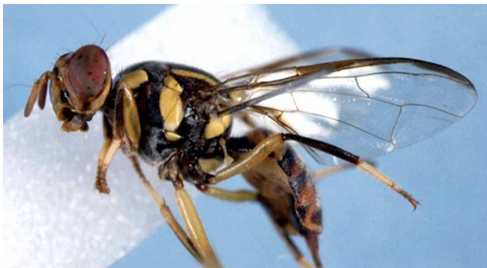
Figura 1. Adulto de Bactrocera dorsalis .