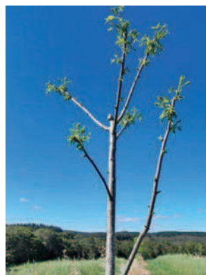
Poda de formação em líder central