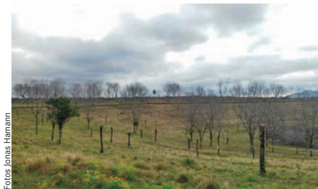
Poda para substituição da cultivar copa