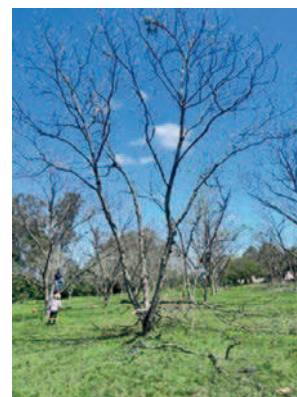
Poda de renovação