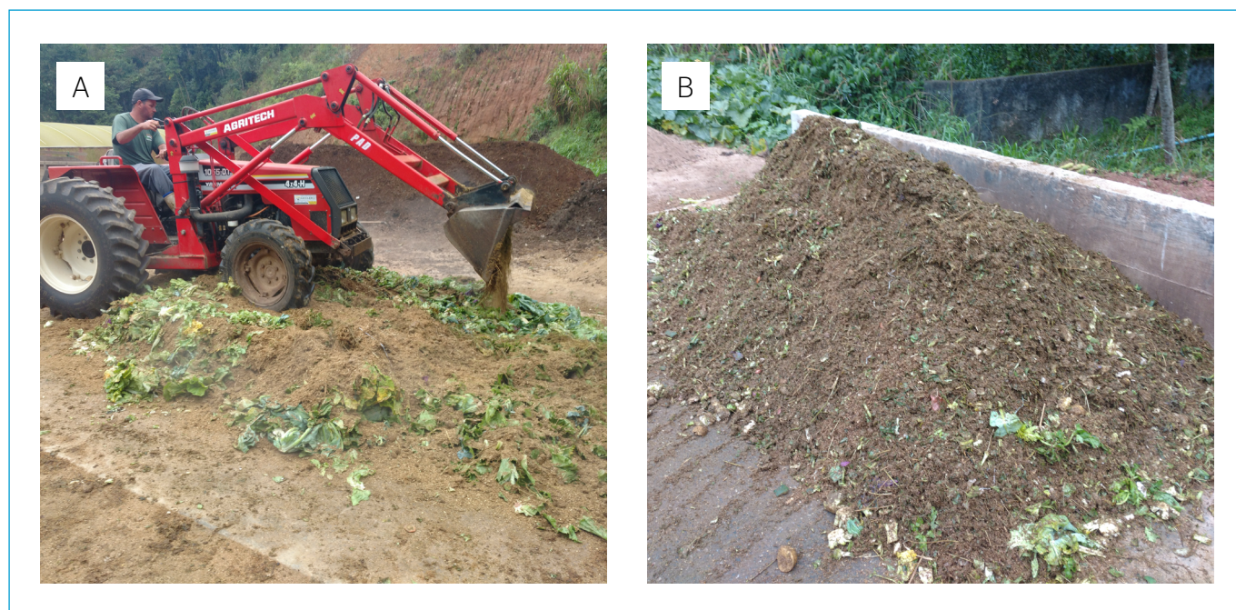
Figura 2 – Preparação da mistura (restos de hortaliças + cama de equino).