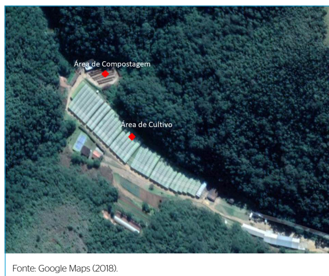
Figura 3 – Vista área do Rancho São Francisco de Paula, mostrando as estufas e a área destinada à compostagem.

foram propostos e analisados quatro possíveis cenários de implantação diferentes, considerando a destinação própria ou terceirizada, bem como o tratamento na própria agroindústria. Em cada cenário, levantaram-se todos os investimentos, os custos e as receitas necessários para a caracterização. Nos Cenários I, II e III, avaliaram-se as formas de destinação e disposição final para os resíduos produzidos na região onde a agroindústria estava instalada, ao passo que, no Cenário IV, foram propostos o tratamento e o beneficiamento na própria área, possibilitando uma nova oportunidade de negócio com a comercialização do composto orgânico.