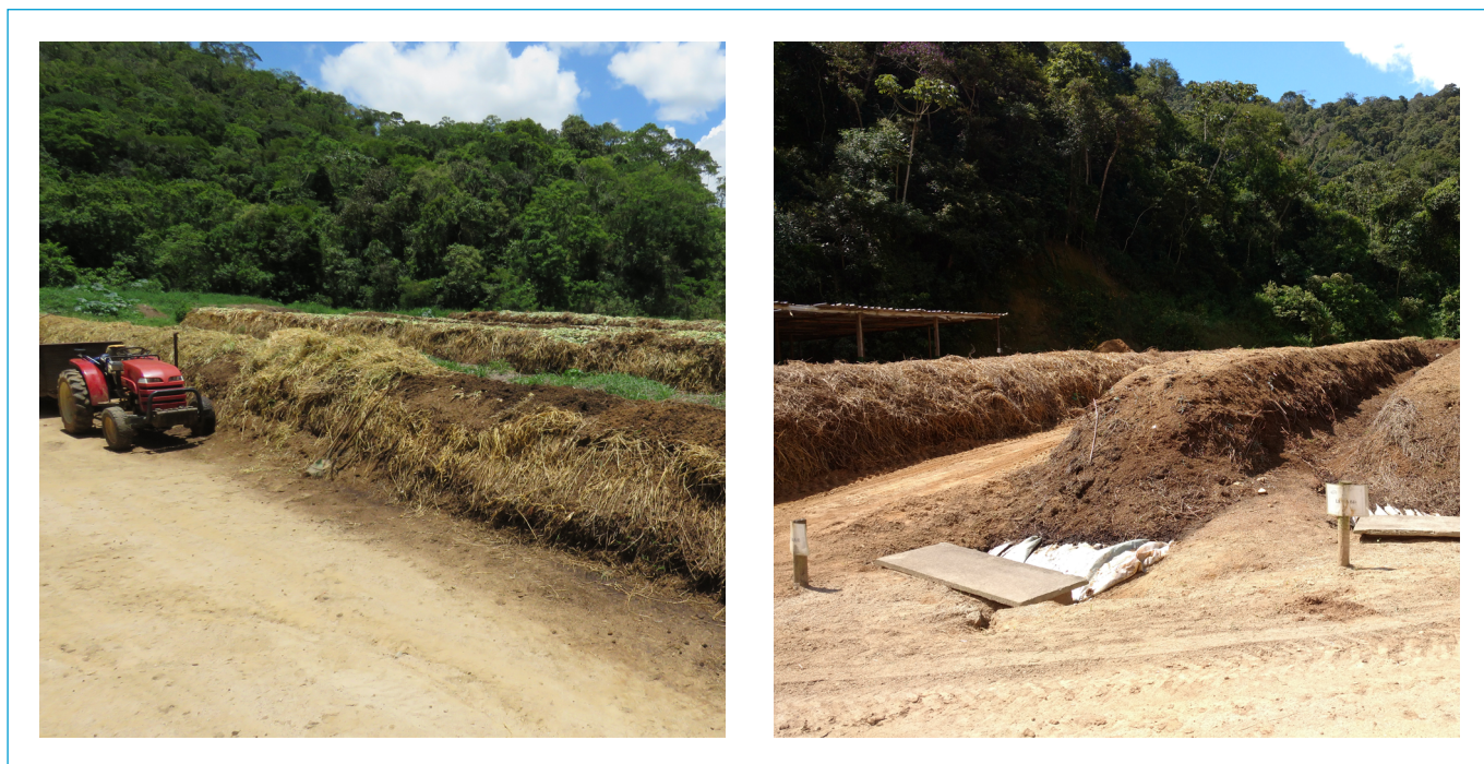
Figura 4 - Pátio de compostagem.