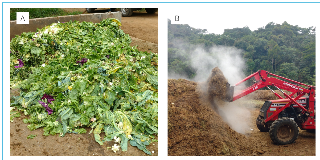
Figura 1 - (A) Restos de hortaliças e (B) cama de equino.

Cada leira foi preparada em local impermeabilizado no terreno destinado ao processo de compostagem. Em todas as leiras foi construído um sistema de drenagem de águas pluviais e efluentes. Na composição das leiras, inicialmente, adicionou-se uma camada de capim