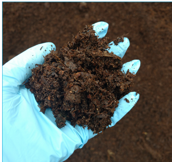
Figura 5 - Composto final (não peneirado).

na agroindústria, objetivando a caracterização e o acompanhamento do sistema de compostagem. Todas as informações foram registradas considerando o inventário da instalação, as máquinas e os equipamentos necessários para o funcionamento, além dos dados técnicos e econômicos de produção da unidade. Dessa forma, foi possível fazer a quantificação e a precificação de toda a unidade de compostagem, construindo o fluxo de caixa para analisar essa proposta de investimento.