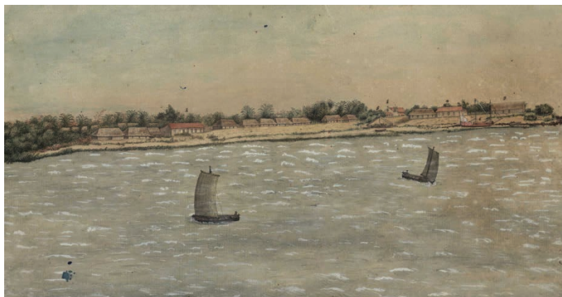
Figura 3. Prospecto de uma das Vilas, a de Monforte, na Grande Ilha de Joannes. A população dessas vilas era responsável pela produção e pela pesca da maior parte da proteína animal que abastecia a cidade de Belém. Desenho em aquarele de José Joaquim Freire.