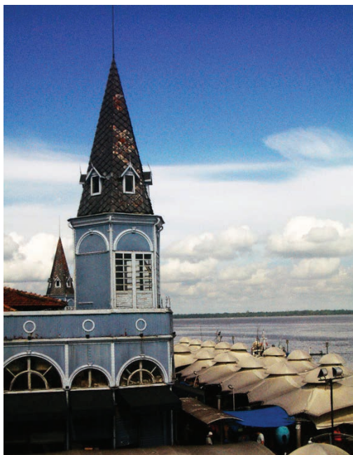
Figura 7. Mercado de Ferro, em meio ao complexo do Mercado do Ver-o-Peso, registro atual.