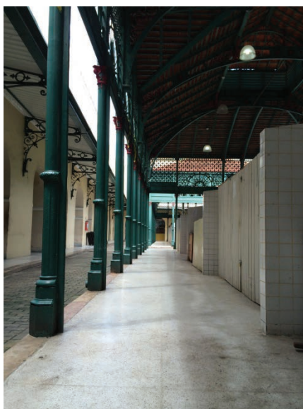
Figura 4. Mercado Municipal de Belém (Mercado da Carne) ainda hoje, mesmo após várias reformas e adaptações, conserva os adornos em ferro fundido, símbolos da preocupação com materiais hígidos e o fausto da época da borracha.

Além da carne verde, a carne salgada, era gênero de primeira necessidade na alimentação da população de Belém (MACÊDO, 2009), nesse caso, principalmente das classes menos abastadas, que consumiam a carne seca proveniente da Ilha do Marajó, acompanhada de farinha d'água e/ou vinho de açaí.