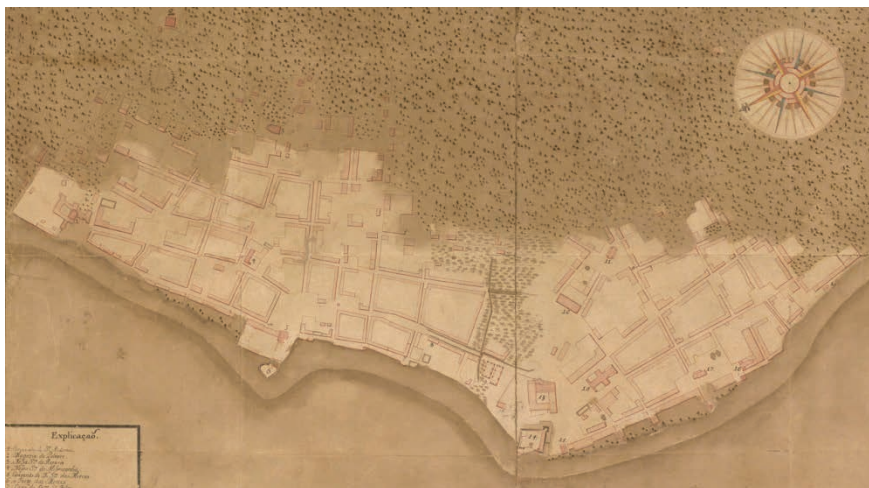
Figura 2. Planta Geométrica da Cidade de Belém do Grão Pará, feita por ordem de Don Francisco Xavier de Mendonça Furtado, capitão general e governador do mesmo Estado, no ano de 1753. Nela é possível ver os dois bairros como compunham a cidade, Cidade, à direita e Campina à esquerda. Na divisão dos dois bairros (em destaque no quadro), a Casa das Canoas e a Alfândega onde se fazia a verificação do peso para recolhimento de impostos.