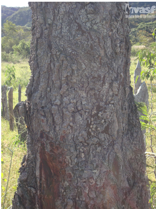
Figura 2. Detalhe do tronco de Anadenanthera colubrina var. cebil . Autor: Fabricio Silva.

Esta variedade difere da Anadenanthera colubrina var. cebil por possuir vagens mais largas, contendo menor quantidade porém maiores sementes. Além disso, as árvores de A. colubrina var. cebil apresentam porte maior do que a var. colubrina (Altschul, 1964).