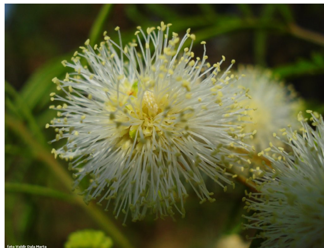
Figura 3. Em destaque a flor de Anadenanthera colubrina var. cebil . Autor: Valdir Dala.