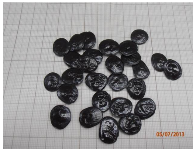
Figura 5. Sementes de Anadenanthera colubrina var. cebil . Autor: Bárbara Dantas, Acervo LASESA.