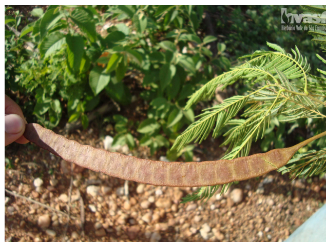
Figura 4. Fruto de Anadenanthera colubrina var. cebil . Autor: Fabricio Silva.