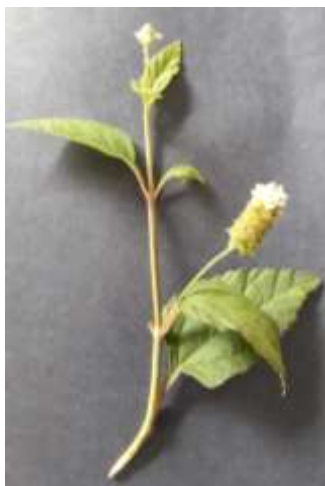
Figura 1. Espécie capim doce.

Os dados obtidos foram submetidos à análise de variância e teste de médias Scott-Knott ao nível de 5% de probabilidade, utilizando o programa estatístico SISVAR (Ferreira, 2011). Foram elaborados gráficos expondo as médias de dias de ocorrência dos eventos fenológicos reprodutivos relacionando-os com as médias mensais do índice de precipitação e da temperatura média do ar com o auxílio do programa Excel. Os dados climatológicos do período estudado foram disponibilizados pela estação meteorológica da Embrapa Amazônia Oriental-Belém, Pará.