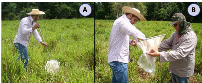
Figura 1. A. Coleta de adultos de cigarrinhas-das-pastagens utilizando rede entomológica de varredura. B. Acondicionamento do material coletado, em saco plástico identificado contendo chumaço de algodão embebido em éter etílico.