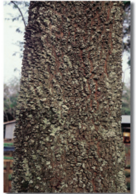
Casca externa