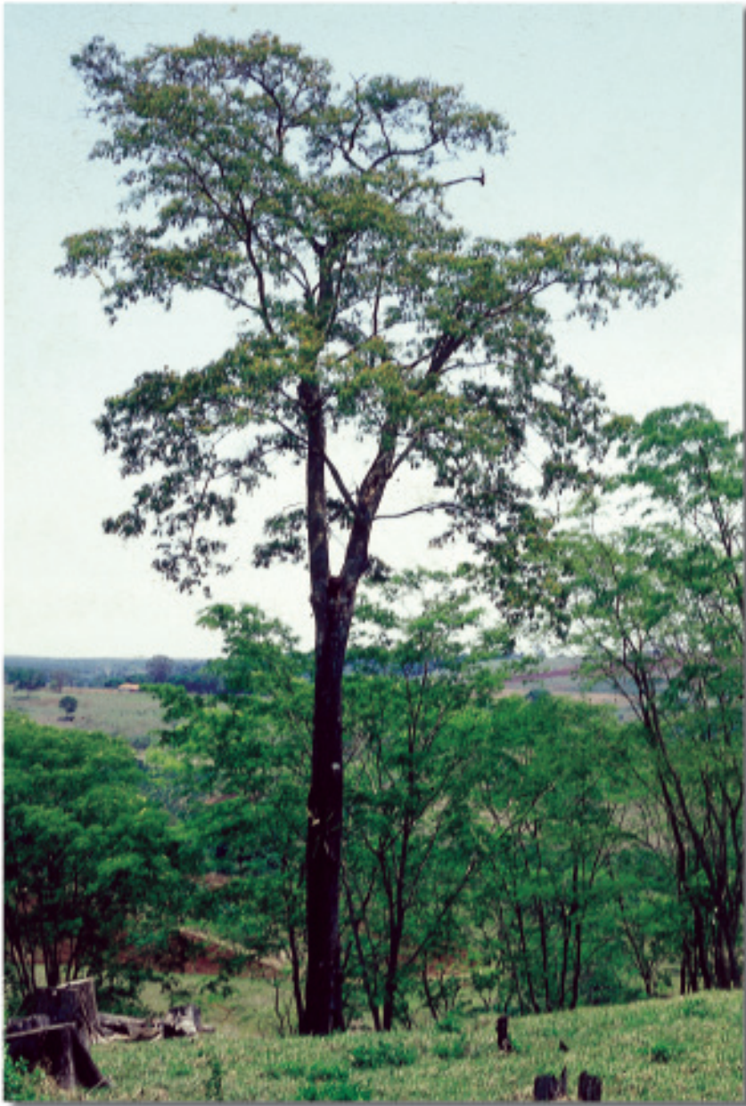
Árvore (Uberlândia, MG)