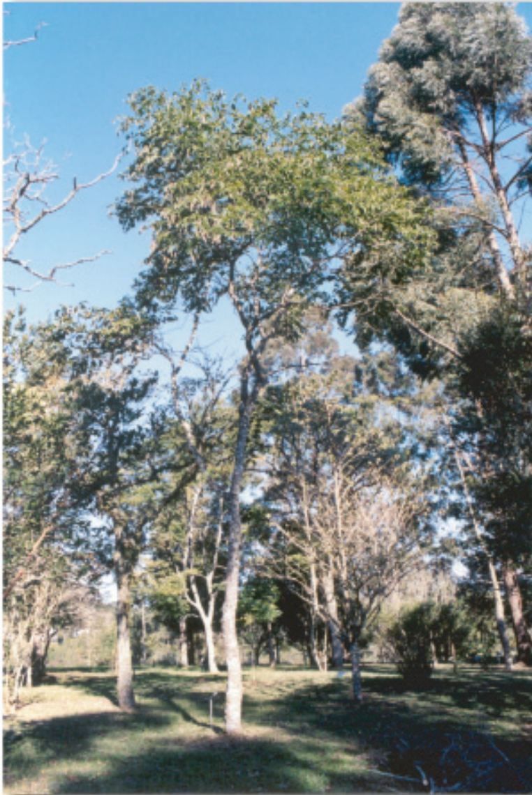
Árvore (Colombo, PR)