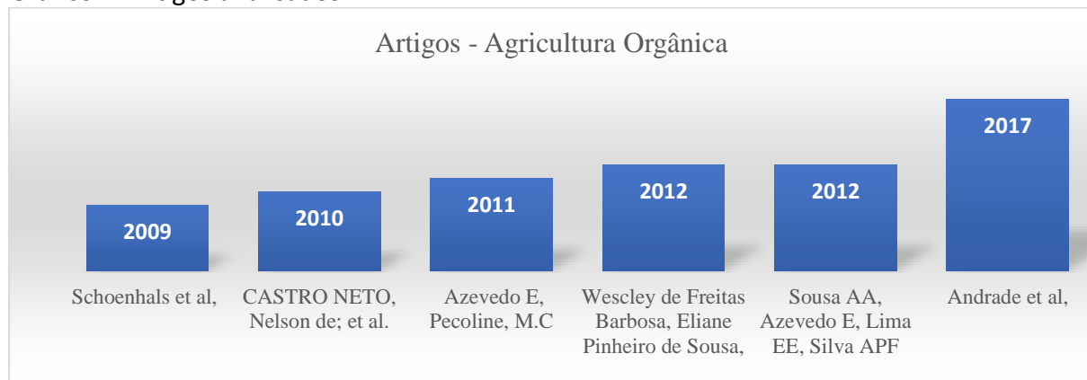
Gráfico 2: Artigos analisados

5) Utilizou-se a análise de conteúdo, proposta por Bardin (1977) para a análise dos artigos completos e das informações relacionadas ao passo 1 desse protocolo. Os resultados foram apresentados em quadros e tabelas. Os documentos eliminados não acrescentavam de forma significativa na elaboração desse artigo. Abaixo o gráfico dos artigos que foram analisados.