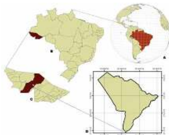
Figura 1 – Localização do Brasil na América do Sul (A); localização do Acre no Brasil (B); localização do município de Feijó no estado do Acre (C); e localização da TI Kaxinawá de Nova Olinda, município de Feijó, Acre (D).

A pesquisa foi realizada no ano de 2016 na TI Kaxinawá de Nova Olinda (TIKNO), situada no município de Feijó, Acre, Amazônia. A área de pesquisa situa-se a 9°06' 08.07''S e 70° 43' 03.55''O, a uma altitude de 197 m, onde predomina o clima tipo Am de Köpen, com verões e invernos úmidos, e curtos períodos de seca. A temperatura média anual é de cerca de 25,8° e a precipitação média anual de 2.200 mm. A TIKNO situa-se no Alto Rio Envira, afluente do Rio Tarauacá, na Bacia do Rio Juruá, no sudoeste da Amazônia brasileira (Figura 1). A TIKNO foi criada pelo Decreto no 294, de 29 de outubro de 1991, com área de aproximadamente 27 mil hectares (FUNAI, 2015). Atualmente, há cinco aldeias: Nova Olinda, Formoso, Boa Vista, Novo Segredo e Porto Alegre, com população total de 492 pessoas. A vegetação da área é de Floresta Ombrófila Aberta (53,1%) e Floresta Ombrófila Densa (46,9%) (Instituto Socioambiental, 2016).