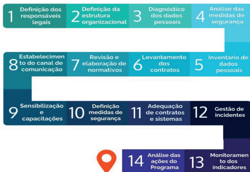
Figura 2. LGPD na Embrapa.