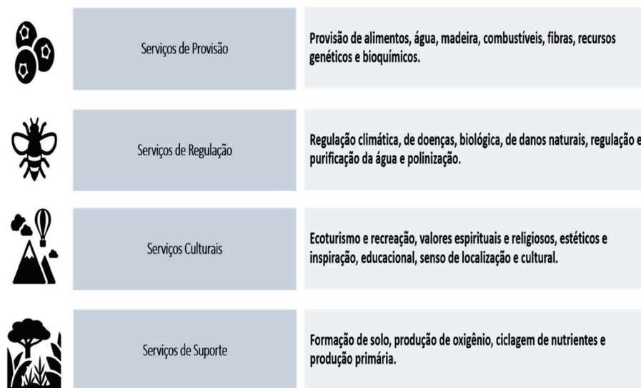
Figura 1. Tipos de serviços ecossistêmicos.

as contribuições diretas e indiretas da natureza para o bem-estar humano. Alguns exemplos dessas contribuições são os alimentos, água doce, regulação do clima, polinização, além da manutenção da biodiversidade e os benefícios não materiais, por exemplo, a contemplação da natureza (Joly et al., 2019). Esse conjunto diverso é frequentemente subdividido de acordo com o tipo de serviços prestados: de provisão, regulação, culturais e suporte (Figura 1; Millennium Ecosystem Assessment, 2005).