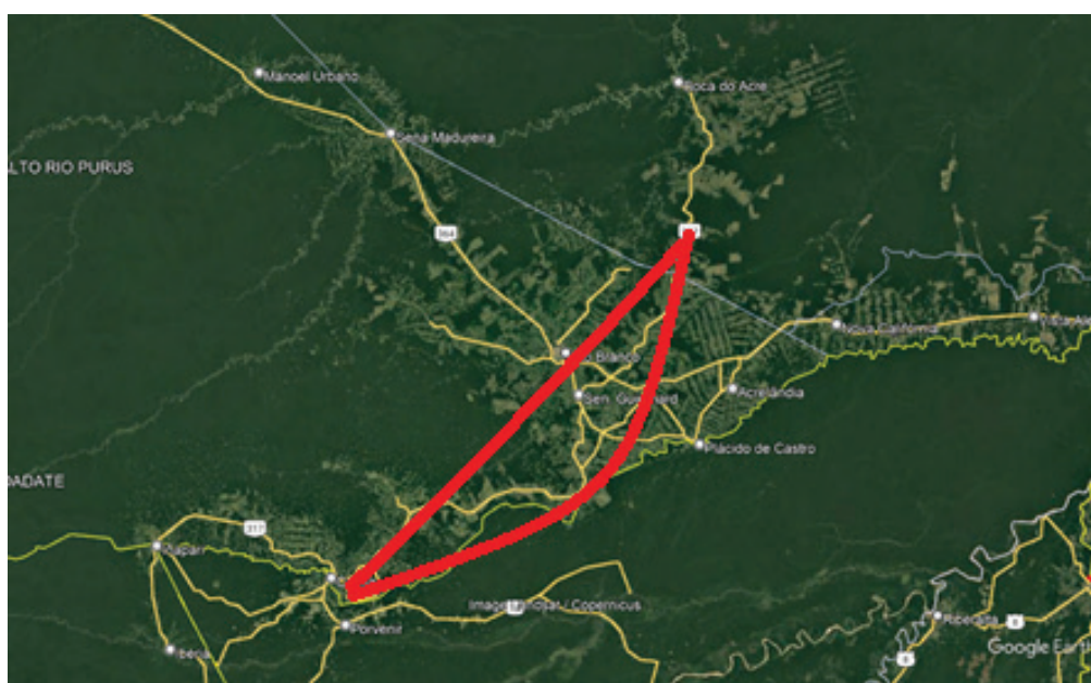
Figura 2. Localização dos plantios de Soja no sudeste do Acre.

A expansão do cultivo da soja no Acre tem se concentrado no sudeste acreano, nos municípios de Senador Guiomard Santos, Plácido de Castro, Capixaba, Rio Branco, Porto Acre, Xapuri e Epitaciolândia, ao longo da rodovia federal BR-317 com poucas áreas na rodovia federal BR-364, confluência com a BR-317 (Figura 2), concentrando-se em poucas médias e grandes propriedades, caracterizadas por apresentarem solos predominantes do tipo Argissolo Vermelho-Amarelo e Vermelho e manchas de Latossolo Vermelho Amarelo, com textura argilosa e média.