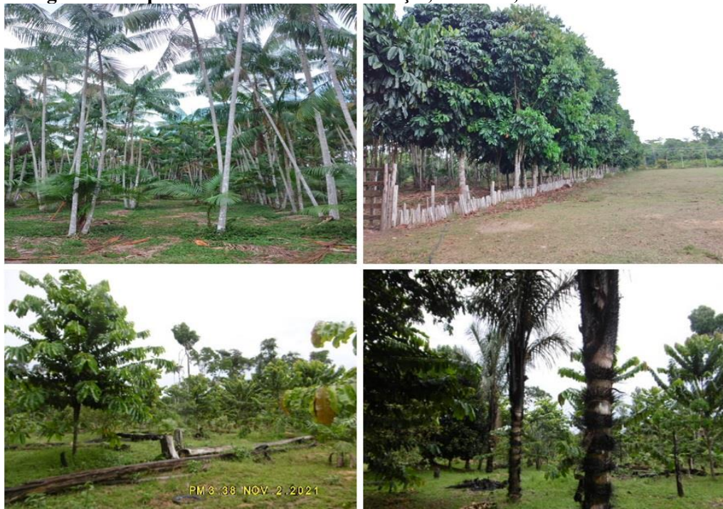
Figura 3 – Aspecto da estrutura vertical Açai, Andioba, Castanha e Tucumã.

hortelazinho ( Menta spicata ), sara tudo ( Justicia acuminatissima ), erva cidreira ( Melissa officialis ) entre outras plantas medicinais usadas de acordo a tradição familiar.