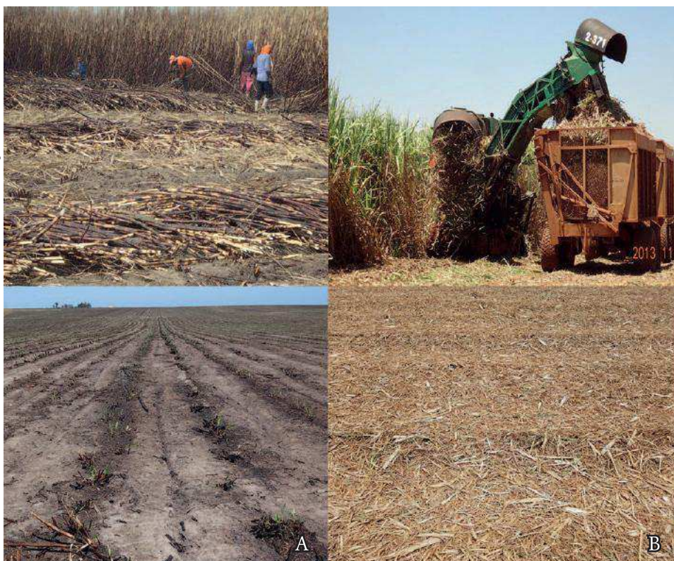
Figura 6. Vista geral da colheita manual da cana-de-açúcar com despalha a fogo e a superfície do solo após a colheita (A); e da colheita mecânica da cana-de-açúcar, deixando o solo coberto com a palha (B).