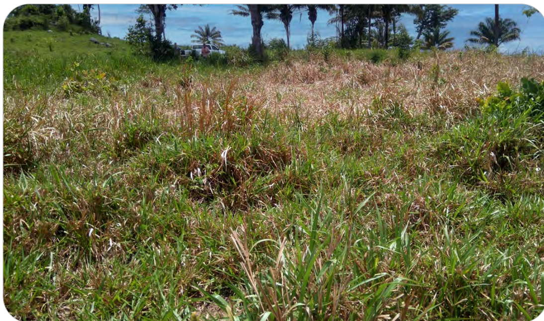
Figura 5.3. Pastagem com Urochloa brizantha cultivar Xaraés atacada por Aeneolamia flavilatera (Hemiptera: Cercopidae).