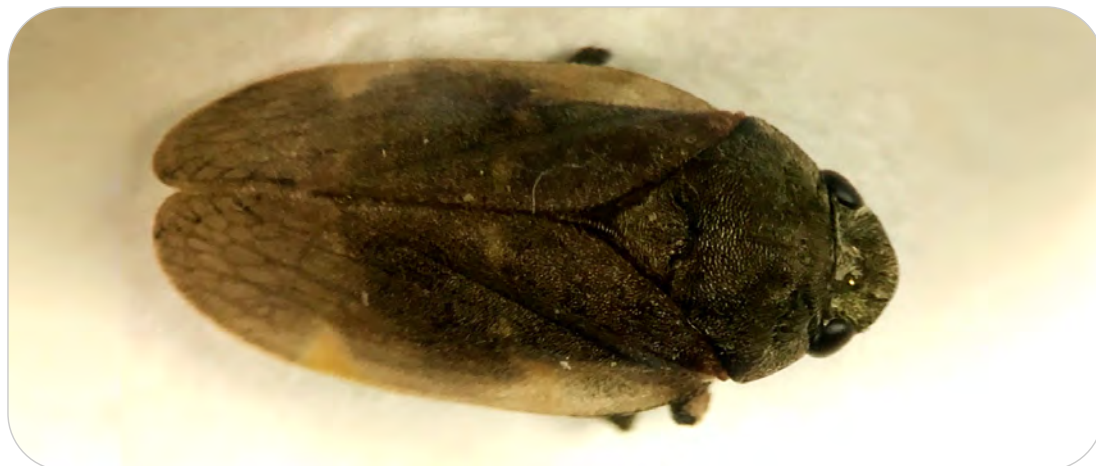
Figura 5.1. Adulto de Aeneolamia flavilatera (Hemiptera: Cercopidae).