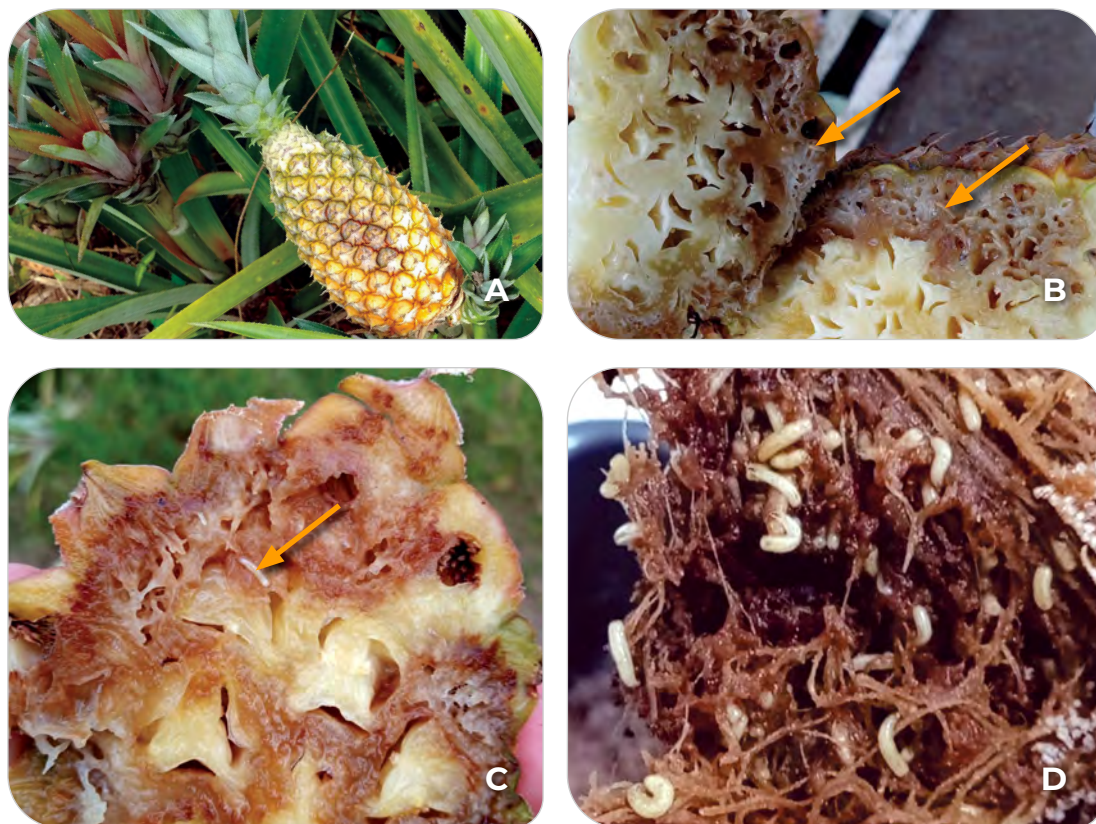
Figura 48.2. Sintomas e danos de Melanoloma viatrix (Diptera: Richardiidae) em abacaxi: sintomas externos causados pelas larvas (A); polpa danificada pelas larvas (setas) (B e C); larvas em abacaxi em avançado estado de decomposição, em laboratório (D).