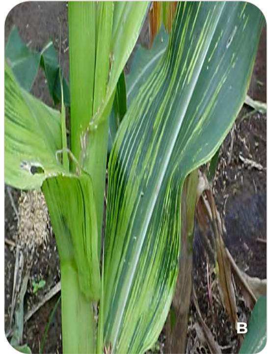
Figura 31.3. Plantas de milho (A e B) com sintomas de “enfezamento” transmitido por Dalbulus maidis (Hemiptera: Cicadellidae).

De maneira geral, quando a infecção ocorre cedo, a planta fica pequena e não cresce, daí o nome de “enfezamento”, como se a planta ficasse enfezada (Cota et al., 2021). As perdas observadas ultrapassam 70% da produção de milho nos estados da região Sul (Massola Júnior et al., 1999; Oliveira et al., 2003). Embora não haja um levantamento pormenorizado de dados, essas perdas são importantes em outras regiões produtoras do Sudeste (Triângulo Mineiro e noroeste de Minas Gerais), Centro-Oeste (Mato Grosso e Goiás), Nordeste (Maranhão, Piauí e Bahia) e Norte (Pará, Rondônia e Tocantins).