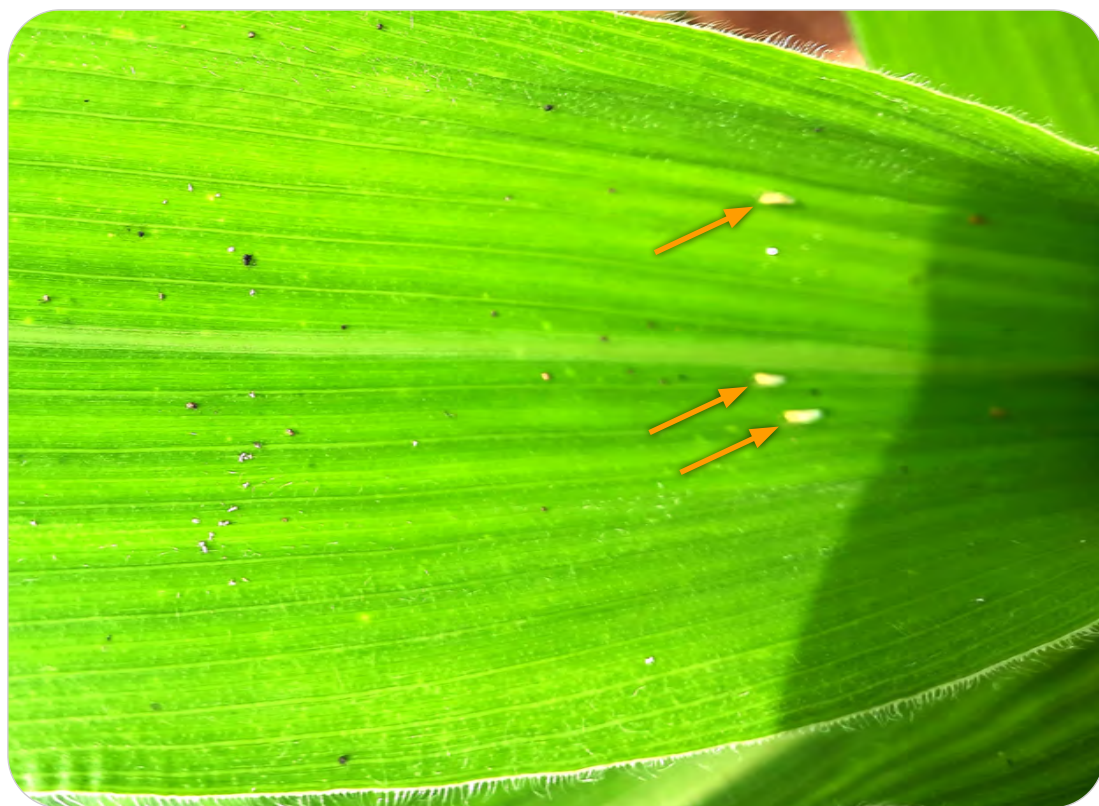
Figura 31.2. Dalbulus maidis (Hemiptera: Cicadellidae) em folha de milho.