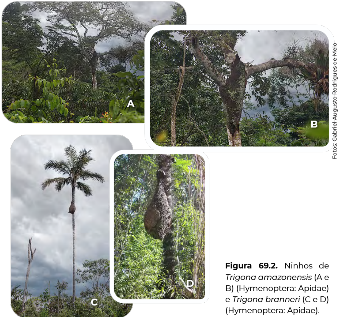
Figura 69.2. Ninhos de Trigona amazonensis (A e B) (Hymenoptera: Apidae) e Trigona branneri (C e D) (Hymenoptera: Apidae).

consideradas generalistas e oportunistas, pois se utilizam de várias fontes na coleta de alimento e material de construção, em ambientes diversos, com diferentes graus de antropização. Adicionalmente, possuem eficiente sistema de comunicação, capaz de recrutar rapidamente grande número de abelhas-operárias, além de ninhos populosos, com cerca de 20 mil a 30 mil indivíduos (Nieh et al., 2004, 2005; Melo, 2020) (Figura 69.2). Consequentemente, já foram descritos danos em diversas espécies botânicas, nativas e cultivadas, com destaque para as frutíferas, conforme exemplificado em Drumond et al. (2019).