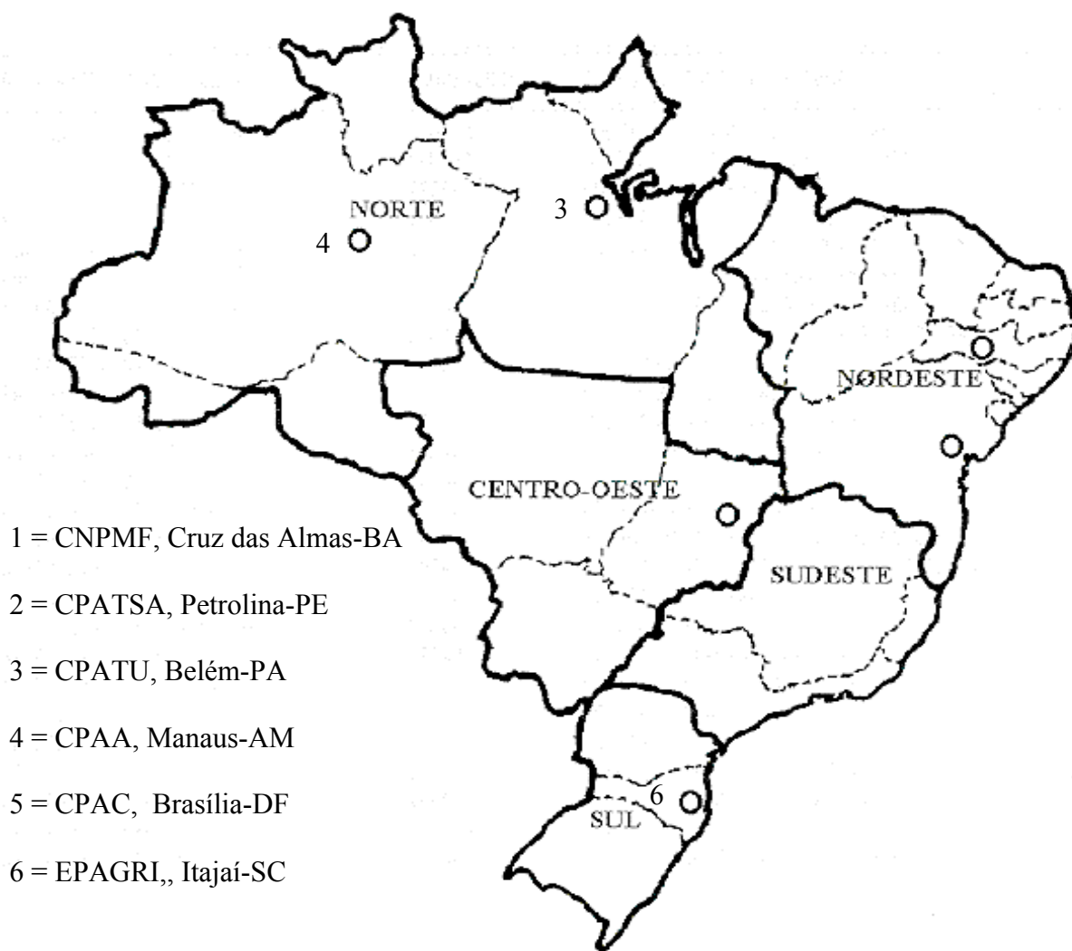
Figura 1 - Distribuição geográfica dos Bancos de Germoplasma de mandioca do Brasil.