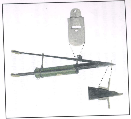
Fig. 4. Semeadora manual adaptada para plantio de sorgo (ANJOS, 2000).

Trabalhos preliminares, realizados por pesquisadores da Embrapa Semi-Árido nos Municípios de Afrânio e Petrolina, no Estado de Pernambuco, para testar a reação de diferentes cultivares de sorgo a doenças que ocorrem no Semi-Árido da Região Nordeste, detectaram a ocorrência de mosaico, ferrugem e antracnose (CHOUDHURY; AGUIAR, 1979a, 1979b).