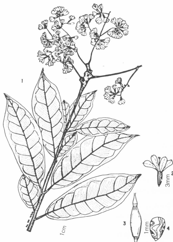
FIG. 1 — 1 — Habitus 2 — Fruto 3 — Semente 4 — Embrião com cotilédone plicado