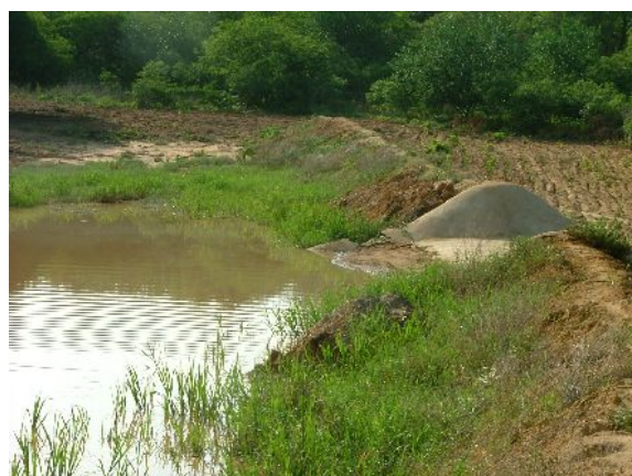
Figura 1 – Divisão área da barragem para coleta de solo (barragem em linha de drenagem)