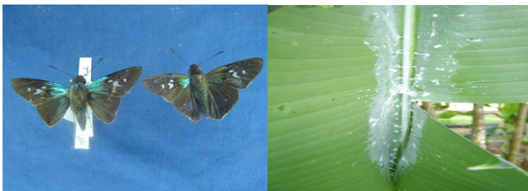
Figura 1. Adultos (A), imaturo e danos (B) de Tracides phidon (Lepidóptera: Hesperiiidae).

Tracides phidon Cramer (Lepidoptera: Hesperiiidae) é a espécie de lagarta desfolhadora mais importante em cultivos de flores tropicais no Pará. Seus adultos são insetos de porte mediano, apresentam coloração, predominantemente, marrom e machas azul-metálico nas asas anteriores e posteriores, próximas à inserção do tórax. Possui, ainda, três machas brancas nas asas anteriores, o que facilita a sua identificação. (Fig. 1A). Seus imaturos podem alcançar até 90 mm de comprimento. Caracterizam-se por apresentar coloração branca farinhenta e produzir, nas folhas atacadas, uma cerosidade também de cor branca (Fig. 2B), o que torna facilmente perceptível a sua constatação.