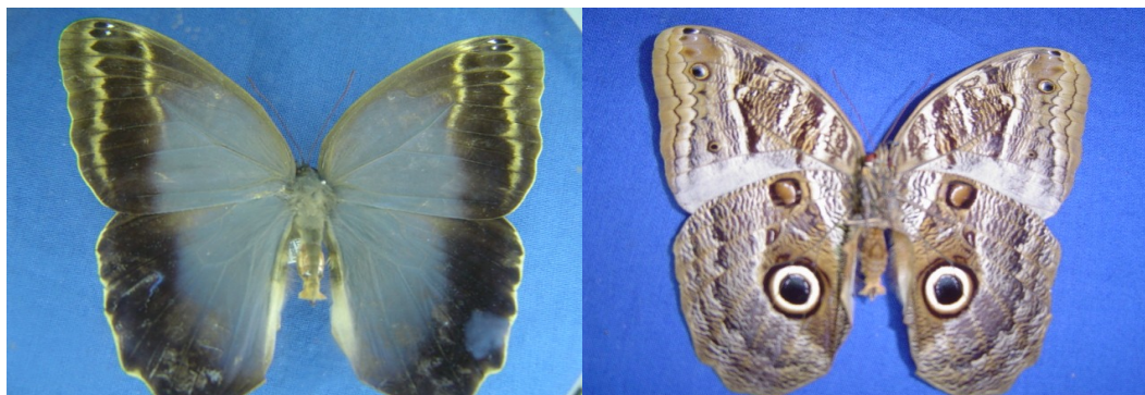
Figura 2. Vista ventral (A) e dorsal (B) de adultos da lagarta desfolhadora Calligo illioneus (Lepidoptera: Nymphalidae)

até 100 mm de comprimento, coloração parda e presença de listas escuras longitudinais e extremidade do corpo bifurcada. O ciclo de vida de C. illioneus é em torno de quatro meses (Gallo et al., 2002).