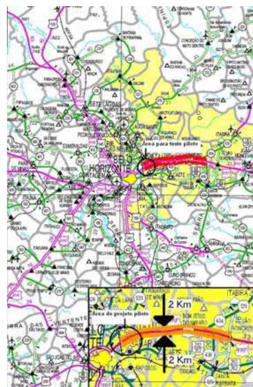
Figura 1. Região do cerrado mineiro produtora do coco da macaúba usado neste trabalho.

Tratamento pós-colheita: O fruto foi colhido, imerso em vapor para inativação das enzimas naturais e redução da carga microbiana.