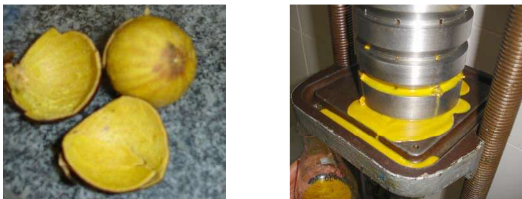
Figura 2. Fruto da macaúba e prensa hidráulica usada no processo

Análises: O teor de umidade e o teor de óleo na polpa foram determinados pelos métodos padrões da AOAC (2000). O índice de acidez foi determinado pelos métodos padrões da AOCS (1996).