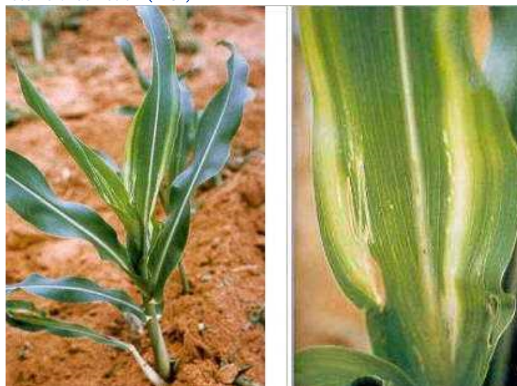
Figura 5. Sintomas de deficiência de zinco.