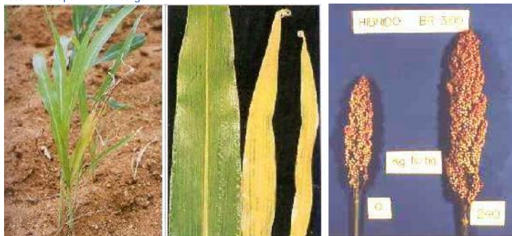
Figura 2. Sintomas de deficiência de nitrogênio.

Clorose nas pontas e margens das folhas mais velhas seguida por secamento, necrose ("queima") e dilaceração do tecido; colmos com internódios mais curtos; folhas mais novas podem mostrar clorose internerval típica da falta de ferro (Figura 3) - Potássio