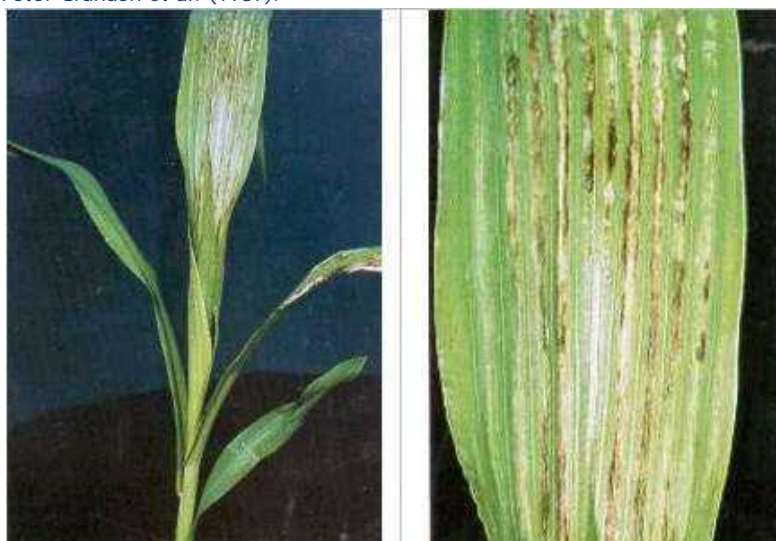
Figura 11. Sintomas de deficiência de manganês.