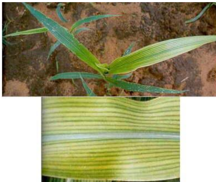
Figura 10. Sintomas de deficiência de ferro.

Clorose internerval das folhas mais novas (reticulado grosso de nervuras) e depois de todas elas, quando a deficiência for moderada; em casos mais severos aparecem no tecido faixas longas e brancas e o tecido do meio da área clorótica pode morrer e desprender-se; colmos finos (Figura 11) - Manganês