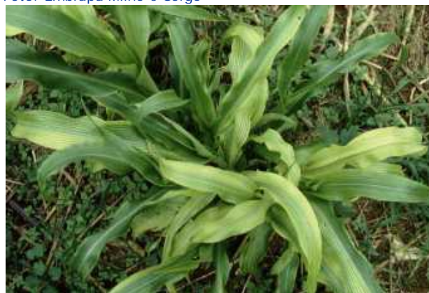
Figura 4. Sintomas de deficiência de magnésio.

Faixas brancas ou amareladas entre a nervura principal e as bordas, podendo seguir-se necrose e ocorrer tons roxos; as folhas novas se desenrolando na região de crescimento são esbranquiçadas ou de cor amarelo - pálido, internódios curtos (Figura 5) - Zinco