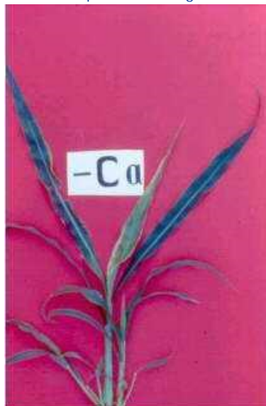
Figura 7. Sintomas de deficiência de cálcio.

Faixas alongadas aquosas ou transparentes que depois ficam brancas ou secas nas folhas novas, o ponto de crescimento morre; baixa polinização; quando as espigas se desenvolvem podem mostrar faixas marrons de cortiça na base dos grãos (Figura 8) - Boro