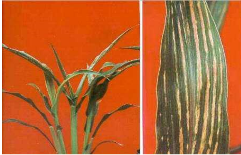
Figura 8. Sintomas de deficiência de boro.

Amarelecimento das folhas novas logo que começam a se desenrolar, depois as pontas se curvam e mostram necrose, as folhas são amarelas e mostram faixas semelhantes às provocadas pela carência de ferro; as margens são necrosadas; o colmo é macio e se dobra (Figura 9) - Cobre