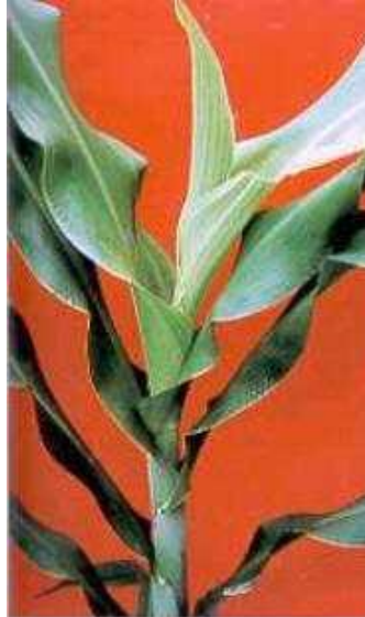
Figura 9. Sintomas de deficiência de cobre.

Clorose internerval em toda a extensão da lâmina foliar, permanecendo verdes apenas as nervuras (reticulado finas de nervuras) (Figura 10) - Ferro