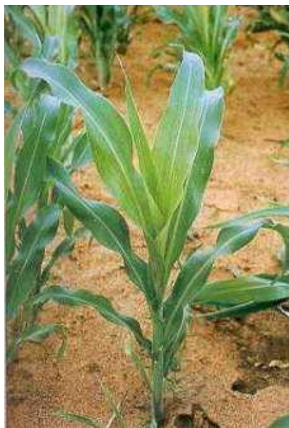
Figura 12. Sintomas de deficiência de enxofre.