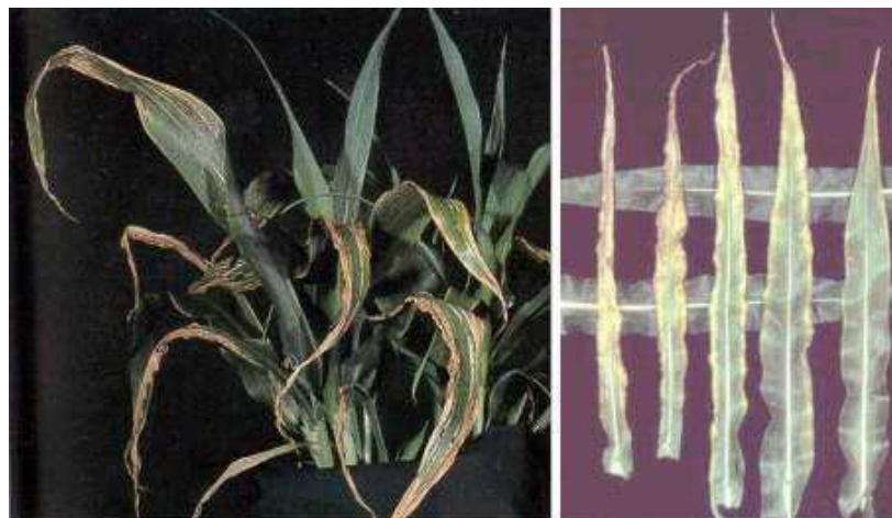
Figura 3. Sintomas de deficiência de potássio.

As folhas mais velhas amarelecem nas margens e depois entre as nervuras dando o aspecto de estrias; pode vir a seguir necrose das regiões cloróticas; o sintoma progride para as folhas mais novas (Figura 4) - Magnésio