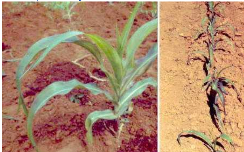
Figura 6. Sintomas de deficiência de fósforo.

Pequenas manchas brancas nas nervuras maiores, encurvamento do limbo ao longo da nervura principal - Molibidênio.