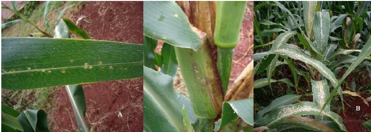
Figura 2: Plantas de milho da cultivar DAS 657 tratada com oxitetraciclina d (A) e não tratada (B)

Os resultados demonstram a eficiência do princípio ativo oxitetraciclina no controle de P. ananatis , comprovando os resultados obtidos em laboratório.