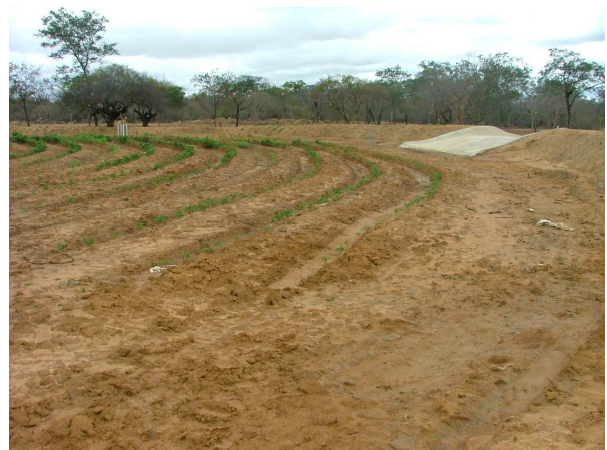
Figura 2. Barragem subterrânea pronta cultivada com feijão