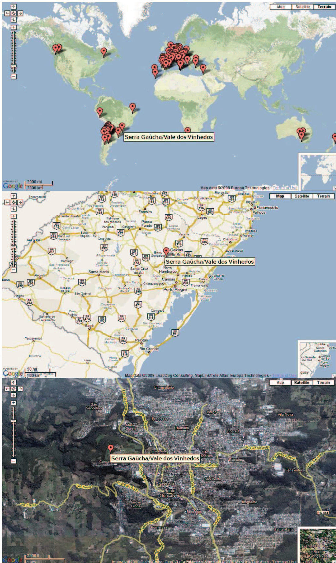
Figura 3. Exemplos de mapas do Sistema CCM Geovítica.