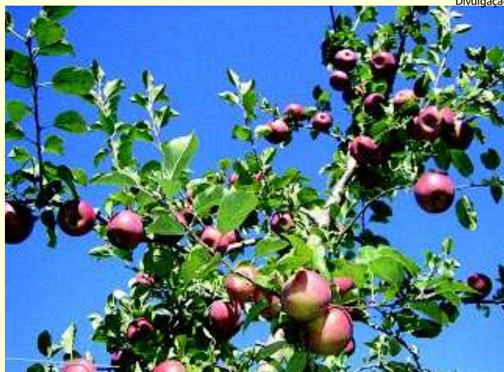
O estado nutricional da planta tem efeito direto sobre a produtividade e a qualidade de frutos

Embora tenha sido verificada a eficiência do Dris no diagnóstico nutricional, o período de amostragem ainda continuava sendo um entrave para o diagnóstico nutricional da macieira. Para