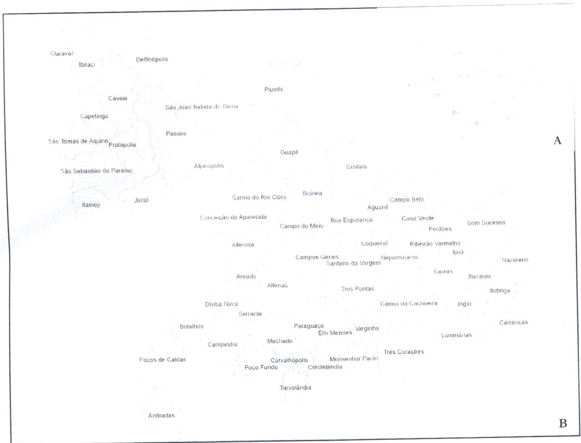
Figura 1 – Estado de Minas Gerais: A) região onde foi feito o levantamento; B) municípios da região em que as amostras foram coletadas.