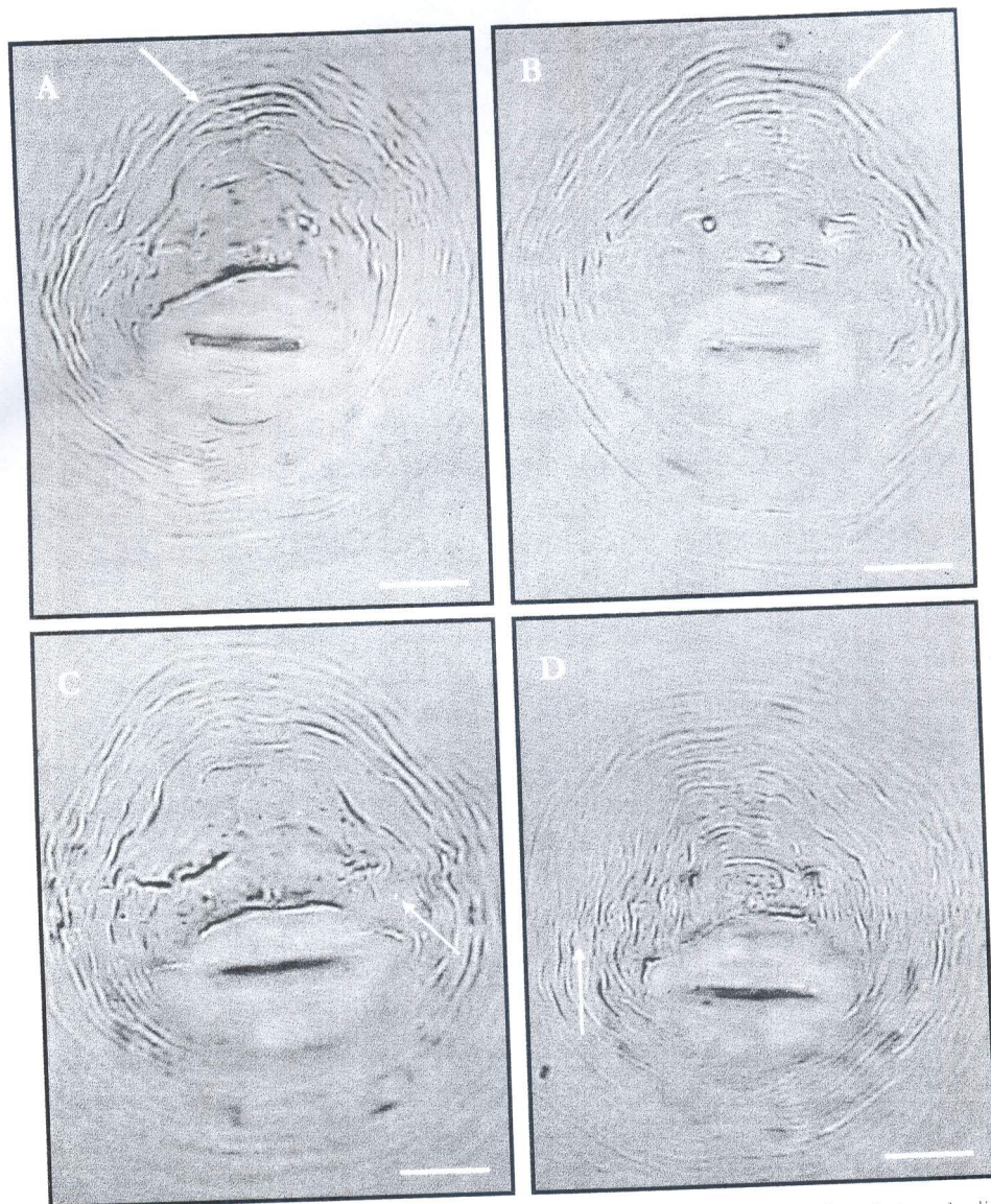
Figura 2 – Configurações perineais de Meloidogyne exigua , cujas fêmeas foram extraídas das raízes de cafeeiros de diferentes municípios da região Sul de Minas Gerais. Os detalhes indicados pelas setas são: A) estrias grossas; B) arco dorsal baixo; C) linhas do campo lateral imperceptíveis, demarcadas por estrias que se dobram; D) ou que se interrompem. Barras = 10 \mu m.