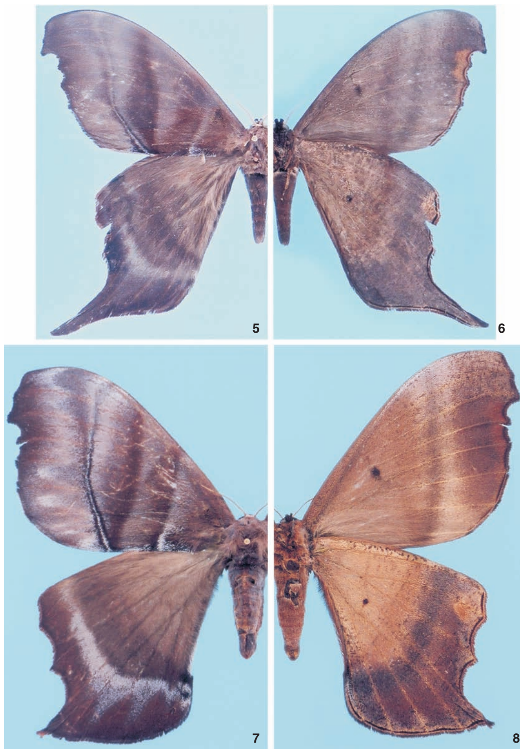
Figuras 5-8. Paradaemonia platydesmia : (5-6) macho, 18-I-1979, Santa Isabel, Pará, Brasil: (5) dorsal; (6) ventral; (7-8) fêmea, 3-VII-1999, Piste de Kaw, PK 36, Guiana Francesa: (7) dorsal; (8) ventral.