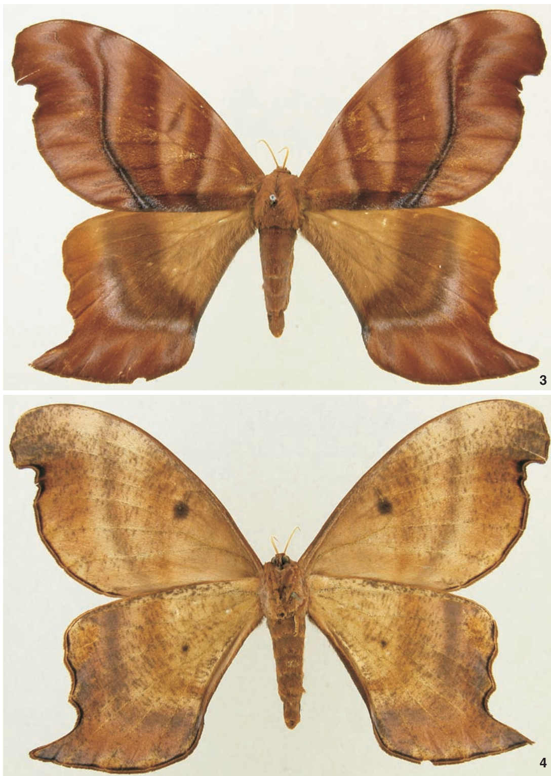
Figuras 3-4. Paradaemonia meridionalis sp. nov., alótipo fêmea: (3) dorsal, (4) ventral.