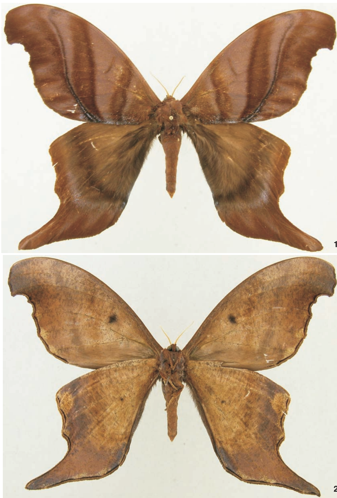
Figuras 1-2. Paradaemonia meridionalis sp. nov., holótipo macho: (1) dorsal; (2) ventral.