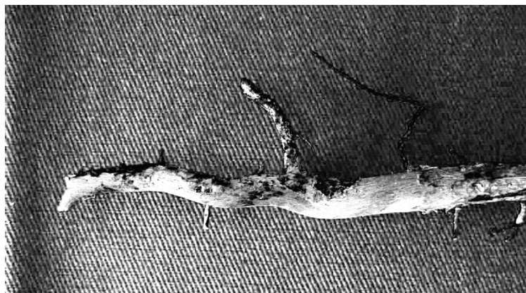
Fig. 1b. Raiz afetada pela podridão-de-carvão.