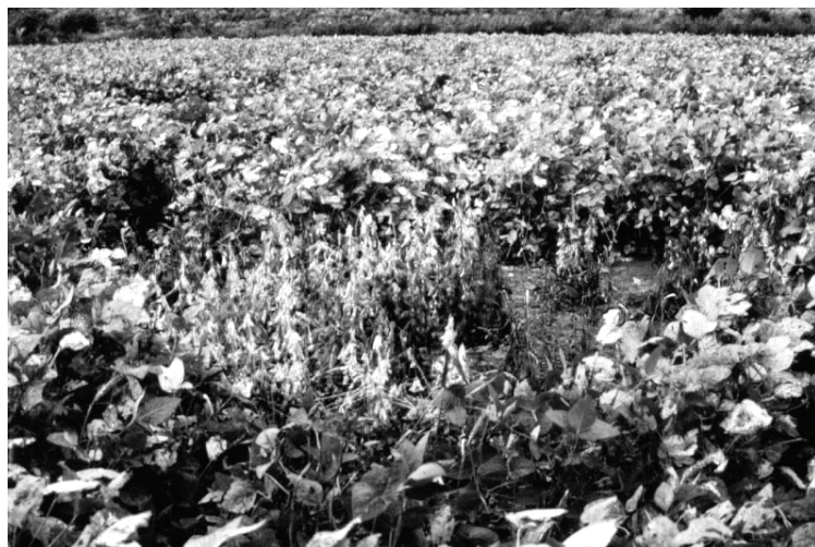
Fig. 1a. Característica de plantas na fase R5 afetadas por Macrophomina phaseolina .

A umidade determinada pelo sensor foi maior, na maioria das vezes, na semeadura direta. Entretanto, constatou-se que solo compactado, como geralmente ocorre com a maioria dos solos sob semeadura direta, tem probabilidade de atingir maiores níveis de infecção, independente da concentração de microesclerócios.