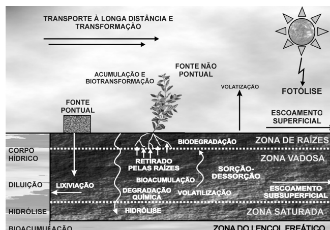
Figura 1. Principais rotas de transporte e degradação de agrotóxicos no ambiente. Adaptada da ref. 138

Portanto, os agrotóxicos além de cumprirem o papel de proteger as culturas agrícolas das pragas, doenças e plantas daninhas, também podem oferecer riscos à saúde humana e ao meio ambiente. Os usos frequentes de agrotóxicos, muitas vezes incorretos, favorecem os riscos de contaminação de diversos compartimentos ambientais, como a contaminação de solos agrícolas, de águas superficiais e subterrâneas e de alimentos, podendo, em episódios mais graves, inviabilizar o consumo destes. Isso pode apresentar, consequentemente, riscos de efeitos negativos em organismos terrestres e aquáticos, como intoxicação pelo consumo de água e de alimentos contaminados, além da intoxicação ocupacional de trabalhadores e produtores rurais. Na Figura 1 são apresentados, esquematicamente, os processos principais que atuam na movimentação e na degradação de agrotóxicos na natureza, ilustrando os meios mais prováveis onde esses compostos podem ser encontrados. 138