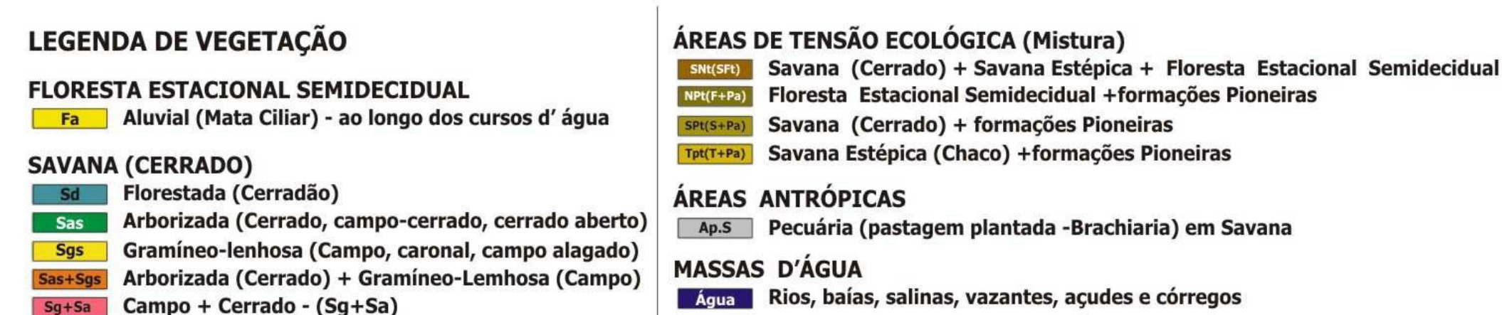
Figura 2. Participação das diferentes fisionomias mapeadas no PEPRN