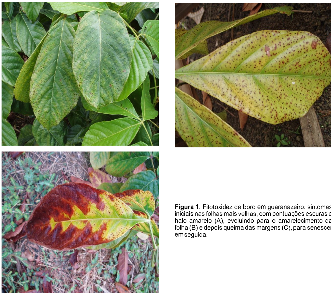
Figura 1. Fitotoxidez de boro em guaranazeiro: sintomas iniciais nas folhas mais velhas, com pontuações escuras e halo amarelo (A), evoluindo para o amarelecimento da folha (B) e depois queima das margens (C), para senescer em seguida.