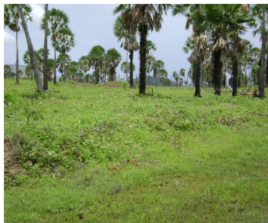
Foto 2 - Preservação das carnaúbas

Assim foi preservando um corredor agroecológico, os limites das quatro propriedades foram arborizados com o Neen ( Azadirachta Indica ), planta indiana em espaçamento 2 x 2 servindo como quebra vento e fornecedor de insumos para confecção de inseticidas