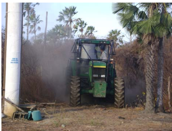
Foto 1 - Corte seletivo da caatinga

Nesse contexto foi realizado um corte seletivo da caatinga (Foto 4), por meio do equipamento “Tipitamba” que na língua dos índios Tiriyó, do norte do Estado do Pará, quer dizer ex-roça ou capoeira. Esse equipamento foi desenvolvido pela Embrapa Amazônia Oriental em conjunto com Universidades alemãs de Göttingen e Bonn, por meio de convênio de cooperação internacional, que visa desenvolver novas alternativas de cultivo sem a utilização do fogo por meio do manejo da vegetação secundária em descanso. O preparo de área via derruba-e-queima, é a prática mais usual local pelos agricultores familiares, que por sua vez é substituído pelo corte e trituração mecanizada da capoeira, que passa a ser utilizada como cobertura morta do solo para os cultivos em plantio direto, permanecendo nos módulos dezenas de carnaúbas (Foto 4), planta típica do nordeste brasileiro, predominando nos Estados do Ceará, Piauí e Rio Grande do Norte.