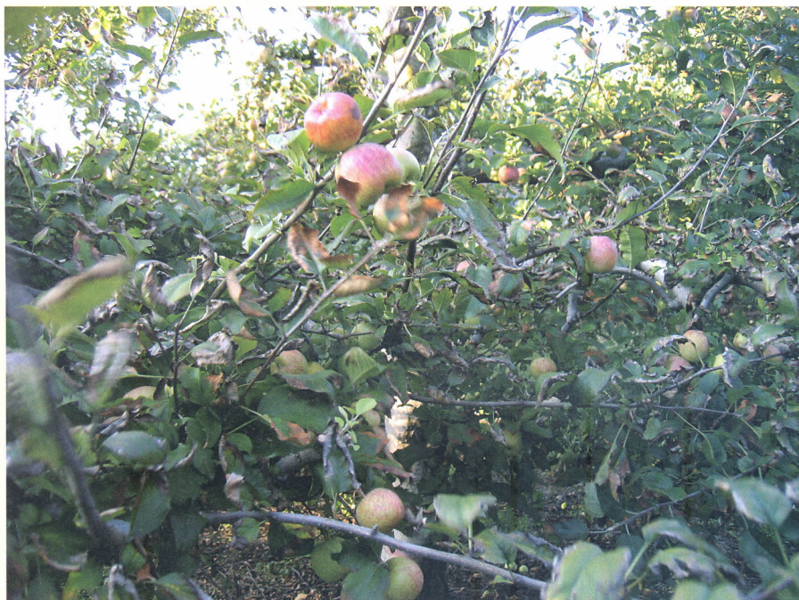
Figura 1. Plantas de macieira com folhas de bordas secas e frutos pequenos causados pela deficiência de K

Nota: L = efeito linear significativo a 5% por regressão polinomial.