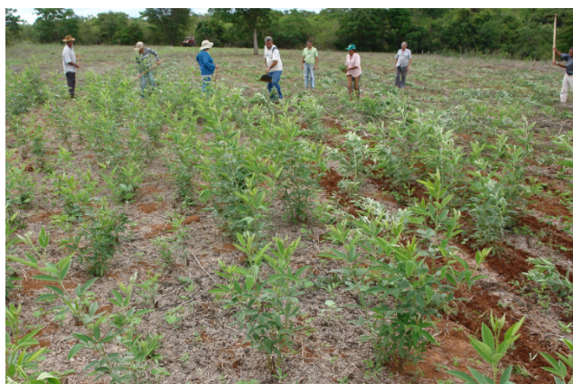
Figura 5 - Capina manual de guandú para posterior semeadura direta de milho. Três Marias, MG. 2009.