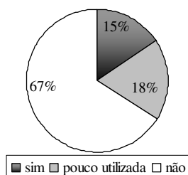
Figura 2. Relevância do uso da adubação verde em agricultura familiar em 65 municípios mineiros, conforme relato de extensionistas da Emater-MG. N = 71. Sete Lagoas, 2007.

As espécies mais citadas (Figura 3) foram guandu ( Cajanus cajan ), crotalária ( Crotalaria juncea ) (N=19), leucena ( Leucaena leucocephala ) (N=14), mucuna ( Mucuna sp.) (N=10), estilozantes ( Stylosanthes sp.) (N=10) e feijão-de-porco ( Canavalia ensiformis ) (N=8). Na safra 2007/2008, foram entregues as espécies Crotalaria juncea , guandu ( Cajanus cajan ) e mucuna preta ( Mucuna aterrina ) aos 167 agricultores que demandaram as sementes. Na safra 2008/2009, 224 produtores receberam C. juncea , C. cajan , M. aterrina e feijão-de-porco ( Canavalia ensiformes ).