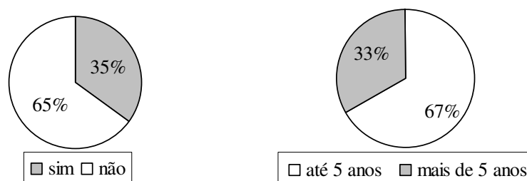
Figura 1. Prática do consórcio milho-leguminosa (N = 63) (a) e tempo de utilização de adubação verde (N = 24) (b) conforme relato de extensionistas da EMATER-MG. Sete Lagoas, 2007.

A adoção da adubação verde ainda é restrita em Minas Gerais, conforme relatado pelos extensionistas da Emater-MG (MATRANGOLO et al., 2008). O consórcio milho-leguminosa (presente em 35% das respostas) mostrou-se restrito ao uso do feijão-comum, sem relato de outras espécies de leguminosas (Figura 1a). Nesse caso, o feijão-comum não atua como adubo verde, embora a diversificação do uso do solo seja benefício incontestável. Os dados são corroborados pelos de Ramalho (1990), que detectou que, no Brasil, mais de 54% do milho comercializado ou estocado em paióis nas propriedades vem do sistema de consórcio, enquanto que no Nordeste brasileiro 89% do milho produzido é proveniente do consórcio feijão; na região Norte, 58%; no Sul, 55%; no Sudeste, 35% e no Centro-oeste, 34%. O fato é que, após 17 anos, essa realidade permanece estável no Sudeste, quando compara-se o dado nacional ao de Minas Gerais. Em torno de 33% das propriedades fazem uso desta tecnologia há mais de 5 anos, sendo que a maioria adotou-a nos últimos 5 (cinco) anos (Figura 1b), o que confirma a pouca adoção da tecnologia e ao mesmo tempo sugere crescimento pela maior frequência de uso recente. No levantamento feito com os extensionistas, pode-se considerar que a adubação verde é prática muito pouco utilizada, presente em apenas 15% dos relatos deles (Figura 2).