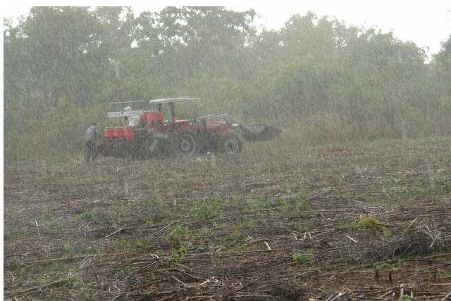
Figura 6 - Semeadura direta de milho (20 de novembro de 2009) sobre palhada de adubos verdes, sob chuva torrencial. Três Marias, MG. 2009.

A produtividade estimada do milho foi de 3.950 kg/ha, na área onde foi cultivado o guandú, e de 5.278 kg/ha, onde foi cultivada a crotalária. A ausência de capina em época adequada na área onde foram colhidas as sementes de mucuna preta não evitou a ressemeadura de parte das sementes que permaneceram nela, que germinaram e cobriram as plantas de milho, o que impediu a avaliação da produtividade. O milho colhido, vendido como semente (2.500 kg, ao preço de R$ 59,00 a saca de 20 kg, rendeu aproximadamente R$ 7.300,00), permitiu a ASBOM a compra de terreno comum, para investimentos destinados à produção orgânica.