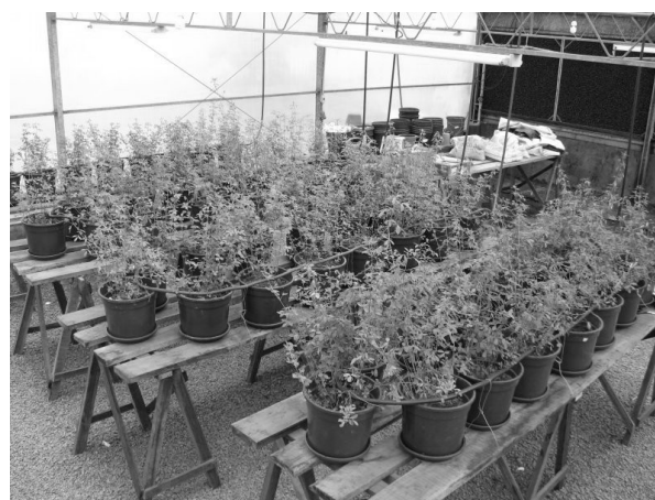
Fig. 2 - Plantio da alfafa em vasos na casa de vegetação com adição dos materiais CF e CG no solo.