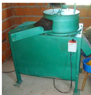
Figura 1. Despulpadora utilizada na extração mecânica da polpa da bociáúva.