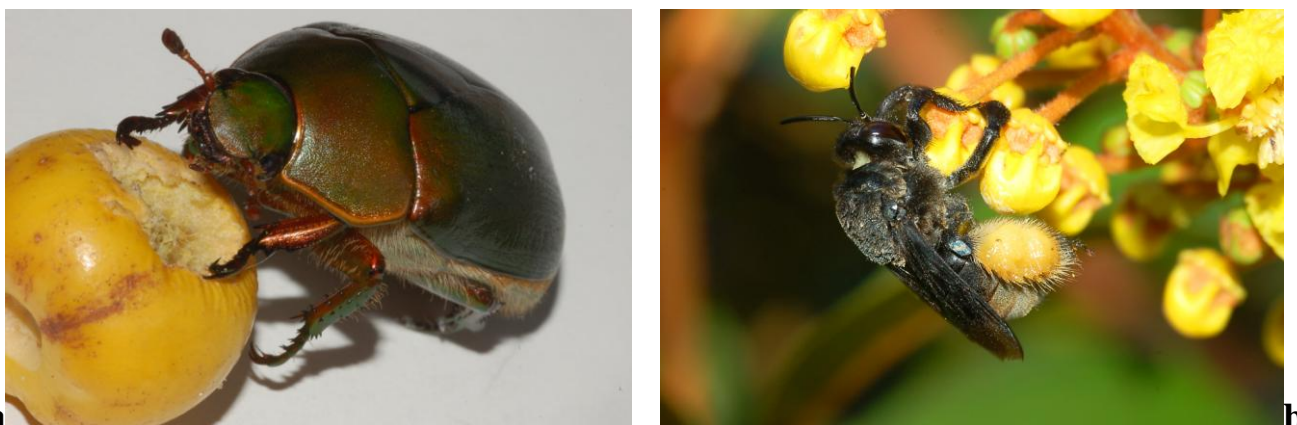
Figura 1 Insetos do murucizeiro, a. Antichera capucina (Scarabaeidae, Rutelinae) e b. Epicharis umbraculata (Apidae, Centridini).

Na Figura 2 observa-se que ocorreu um expressivo aumento na emissão de flores no mês de maio na variedade Açú, enquanto que para a variedade Cristo a floração foi relativamente constante de março a maio.