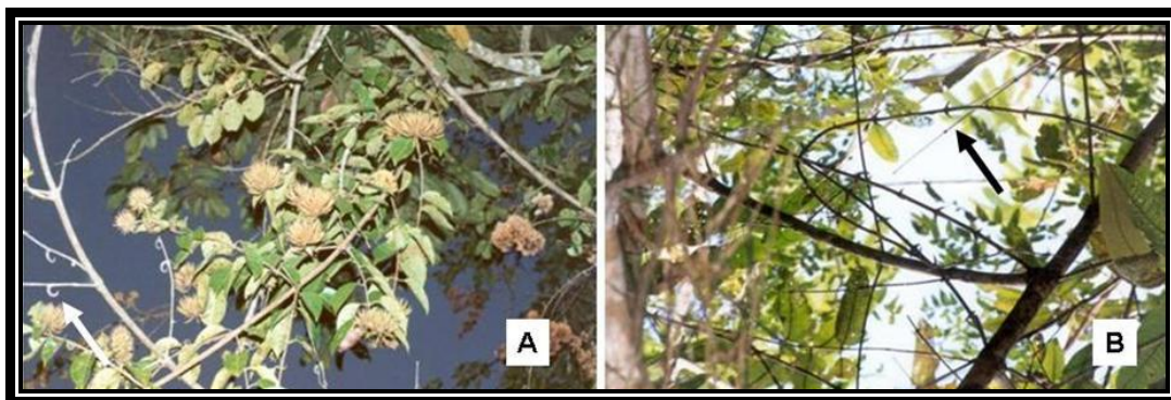
Figura 2. (A) U. guianensis em área de ocorrência natural, observe os espinhos em forma de “chifre de carneiro” (seta branca) e a presença de flores, frutos imaturos e frutos com sementes dispersar. (B) U. tomentosa em área de ocorrência natural, observe os espinhos semicurvados e pontiagudos (seta preta).