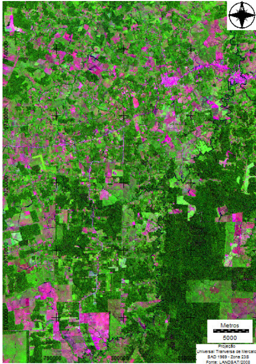
Figura 1. Composição colorida (3/4/5-B/G/R), imagem TM Landsat de 2008.