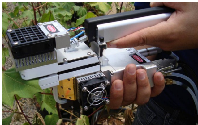
Figura 1. Câmara de fotossíntese do IRGA (Licor, Li-6400, EUA) usada para medidas de trocas gasosas.