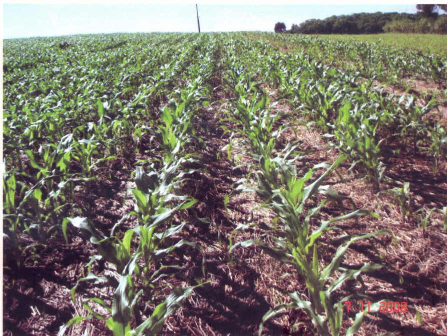
Figura 1. Vista geral do experimento de milho. Chapecó, 2008

Os 11 ambientes em que foram conduzidos os ensaios são constituídos de anos, locais e tipos de ensaio (Intermediários e VCUs). Foram conduzidos quatro ensaios em Chapecó (VCU 2004/05, VCU 2006/07, VCU 2007/08 e Intermediário 2004/05), três em Campos Novos (VCU 2004/05, VCU 2007/08 e Intermediário 2004/05) e quatro em Canoinhas (VCU 2004/05, VCU 2006/07, VCU 2007/08 e Intermediário