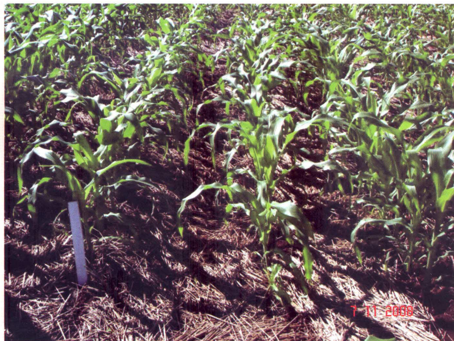
Figura 2. Detalhe da parcela experimental do experimento de milho. Chapecó, 2008

2004/05). A adubação de base e de cobertura foi realizada de acordo com a análise de solo. O controle de plantas daninhas e pragas foi realizado quimicamente, quando necessário. A